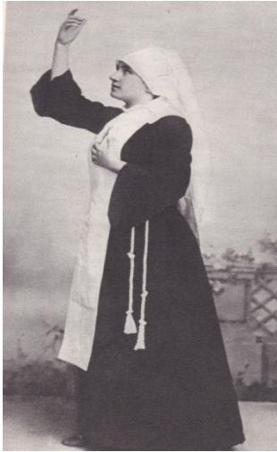
Alberto Franchetti: Asrael (Nefta)